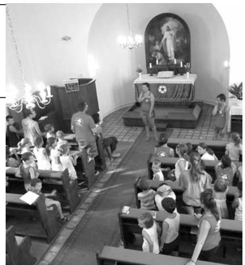
Manóvár tábor, Győrújfalun www.manotanya.hu

A tábor helye Győrújfalun az evangélikus templom melletti táborhely és a Manó tanya. www.visz.org