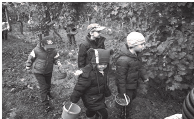
Lipem-lopom a szőlőt...