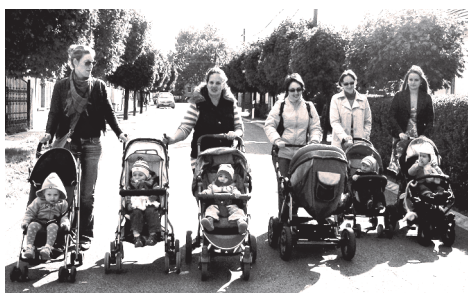
irány az imaház

Egy évtizeddel ezelőtt indítottuk útjára az evangélikus gyülekezetünkben a baba–mama kört. Az idő múlását az első babakörös fényképek sem hagyják feledtetni. A babák, akik a baba–mama kör alapító tagjai, ma már felső tagozatos diákok a város különböző iskoláiban. Lassan konfirmandus korba lépnek. Már régen nem kell lehajolni hozzájuk, meg-