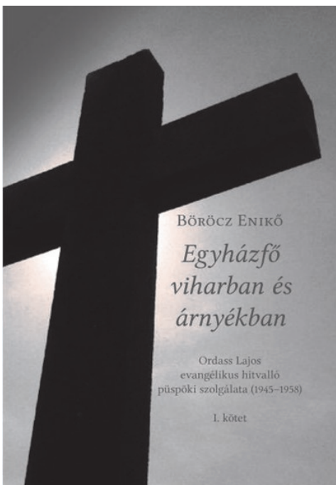
Dr. Böröcz Enikő: Egyházfő viharban és árnyékban Ordass Lajos evangélikus hitvalló püspök szolgálata (1945–1958) I. kötet

„Ha valaki erősebben meg tud állni a viharban, az nem jelent különösebb érdemet, inkább Isten kegyelmének nagyságát kell az illetőnek meghátralnia.”