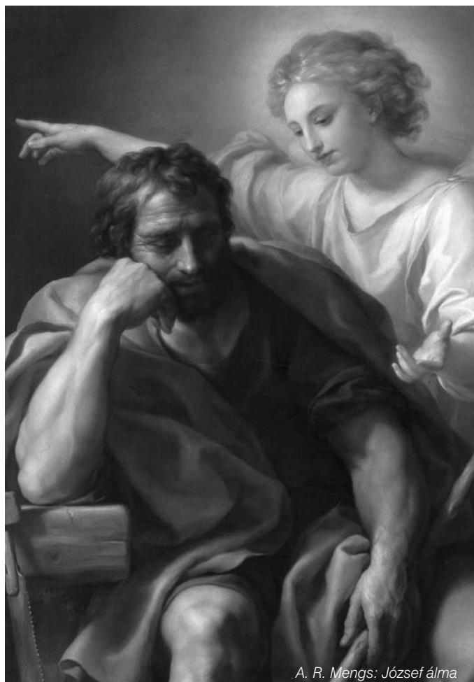
A. R. Mengs: József álma