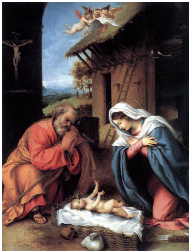
Lorenzo Lotto: Jézus születése, 1523