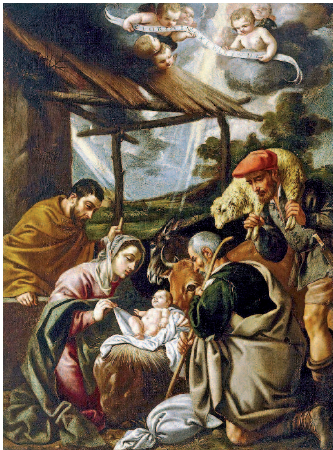
Pedro Orrente képe

„Az Ige testté lett, közöttünk lakott, és láttuk az ő dicsőségét...” (Jn 1,14a)