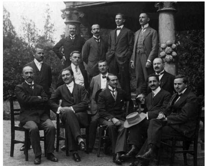
Sopron, az Evangélikus Líceum tanári kara, 1920-ban.

Végül a költözés eredményére való tekintettel – 1921 végére teljesen lekerült a napi